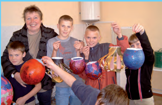
Besuch im Kinderheim Malachowa: „Wir basteln eine Laterne“

Daraufhin wurde 2000 unser Förderverein gegründet. Er umfasst mittlerweile 50 Mitglieder und Assoziierte (allein) auf deutscher Seite. Alle Spenden kommen zu 100% den von uns unterstützten Projekten zugute, der Verein arbeitet ausschließlich uneigennützig. Er behält nichts für eigene Zwecke zurück.