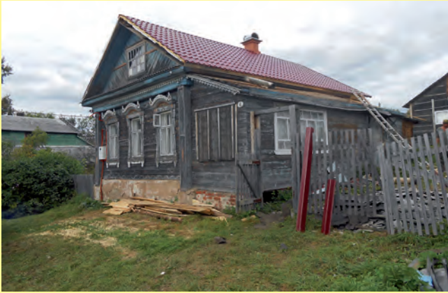
Das Freundschaftshaus mit neu gedecktem Dach.

Mit dem Heranwachsen der Kinder und Jugendlichen hat sich der Verein einem weiteren Projekt angenommen: dem