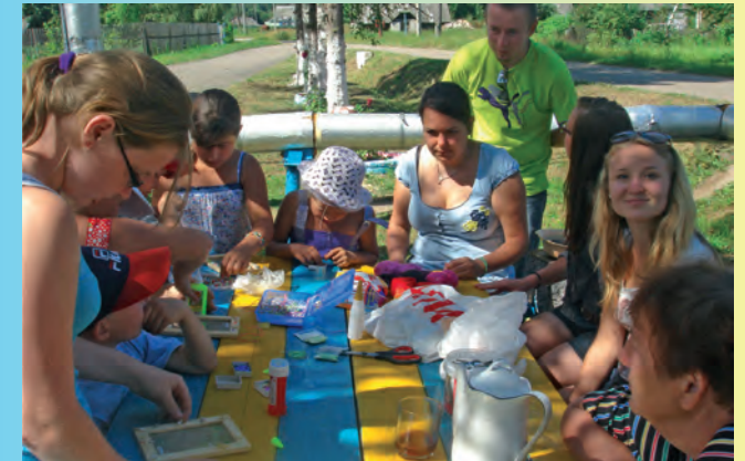
Beim Basteln im Kinderheim Malachowa (Russland)

(Tutajev/Russland) e.V. Waldstetten /Starzach