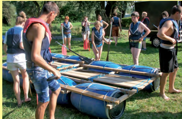
Jugendaustausch: Gemeinsam wird am Bodensee ein Floß gebaut. Auch die gemeinsame Freizeitgestaltung und das Kennenlernen der Landschaft gehören zum Programm.