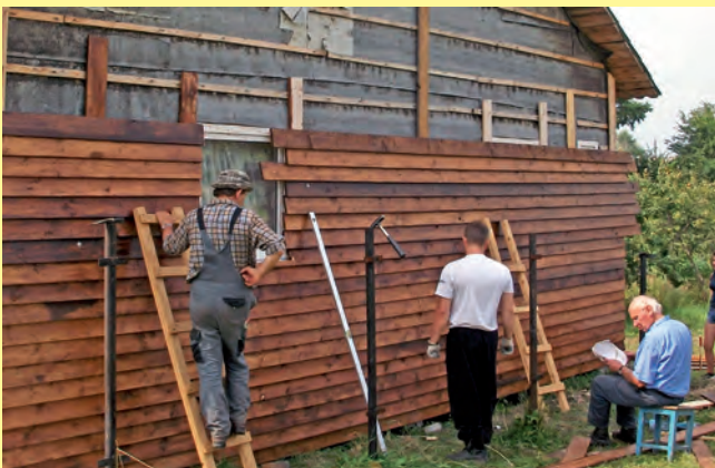
Das Brunnen- und Lagerhaus entsteht.