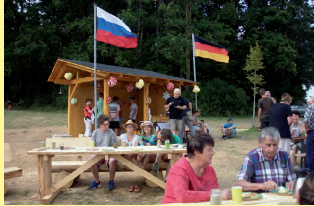
Jugendaustausch: Bei Starzach entstand ein Unterstandhäuschen.

Das Projekt „Freundschaftshaus“ hat zum Ziel, Jugendliche aus unterschiedlichen Nationen und Kulturkreisen zusammenzuführen. Durch gemeinsame Projekte in Deutschland und Russland wird gegenseitiges Vertrauen, Verständnis und Toleranz entwickelt. Das Freundschaftshaus ist ein Holzhaus in Tutajev, das vielen dieser Projekte als Basis dient. Projekte wie Ausbau, Erneuerung und Erweiterung sind Mittel, um das eigentliche Ziel der Völkerverständigung zu vertiefen. Jedes Jahr besuchen deutsche und russische Jugendliche im Wechsel Russland bzw. Deutschland.