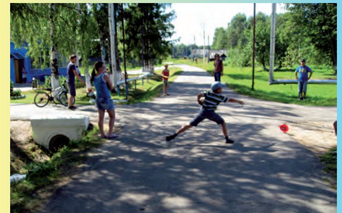
Gemeinsames Spiel in Malachowa

Förderverein Kinderheim Malachowa (Tutajev/Russland) e.V. Waldstetten /Starzach Irmhild Betz-Haberstock, In der Röte 6, 72181 Starzach-Wachendorf Telefon 07478 913113, Telefax 07478 913761 www.malachowa.com , info@malachowa.com